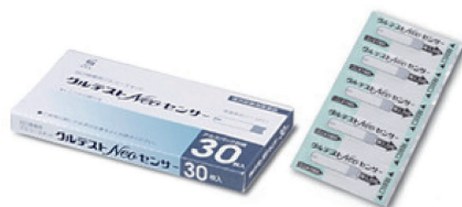
電極センサー (グルテスト neo センサー)