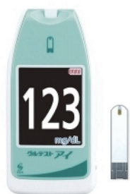
グルテスト アイ 本体