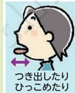
つき出したりひっこめたり