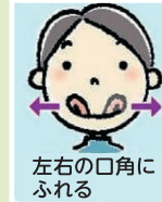
左右の口角にふれる