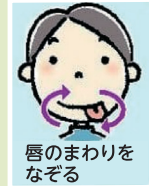
唇のまわりをなぞる